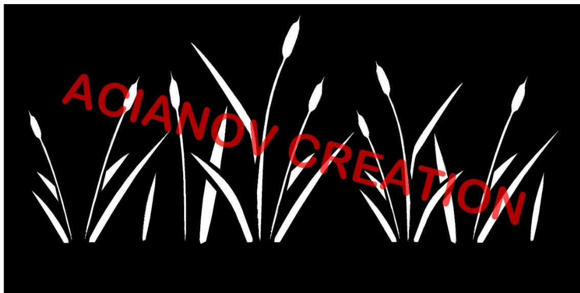
Format présenté : 1000 x 2000 mm

Image à votre format et en couleur (toutes les nuances RAL disponibles) sur simple demande à l'adresse : acianov@orange.fr